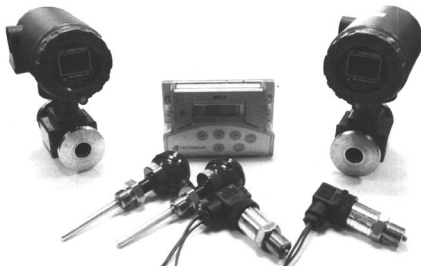
Рисунок 1 – Внешний вид теплосчетчика

Внешний вид теплосчетчика приведен на рисунке 1.